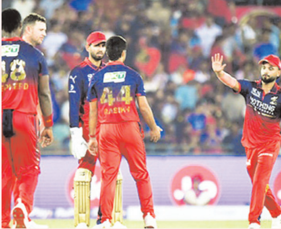
अंक तालिका में दूसरे स्थान पर खिसक गई है। एसआरएच के भी कुल 14 अंक हैं, लेकिन आरसीबी का नेट रन रेट उनसे बेहतर है। गुजरात टाइटंस 14 अंकों के साथ तीसरे नंबर पर काबिज है। वहीं, पंजाब

पहले बल्लेबाजी करते हुए एमआई ने 20 ओवर में 7 विकेट खोकर 166 रन बनाए। एमआई की ओर से तिलक वर्मा ने बेहतरीन बल्लेबाजी करते हुए 42 गेंदों में 57 रनों की दमदार पारी खेली। वहीं, नमन धीर ने 32 गेंदों में 47 रनों का योगदान दिया। हालांकि, आरसीबी ने 167 रनों के लक्ष्य को मैच की आखिरी गेंद पर 8 विकेट गंवाकर हासिल कर लिया। आरसीबी की जीत के नायक करुणाल पांड्या रहे, जिन्होंने 46 गेंदों में 73 रनों की शानदार पारी खेली। वहीं, गेंदबाजी में भुवनेश्वर कुमार ने 23 रन देकर 4 विकेट झटकें। आरसीबी की जीत से सनराइजर्स हैदराबाद (एसआरएच) को नुकसान हुआ है और टीम अब